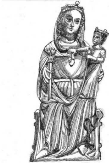
O. L. Vrouw van Renkum Moeder van Toevlucht